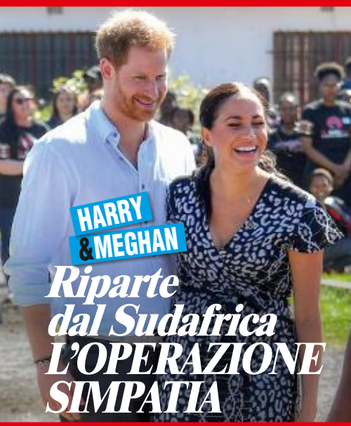
HARRY & MEGHAN

Riparte dal Sudafrica L'OPERAZIONE SIMPATIA